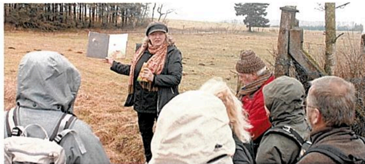
Phänomen Maulwurf „Grabowski“ im Knüll.

Eine Nachtwanderung ohne Taschenlampen bei sternklarem Himmel und Wanderungen mit erlebnispädagogischen Aufgabenstellungen sorgten nach vielen Stunden Büffelei im Gruppenraum für die notwendige Bewegung und Abwechslung. Die Witterungsbedingungen waren nicht immer günstig. Bei eisigem Wind und leichtem Schneefall wurden Ausrüstung und Kondition getestet. Nach einer schriftlichen Prüfung mit sechzig Fragen aus allen Themenbereichen fand am Sonntag die Abschlusswanderung rund um das Knüllköpfchen mit einem praktischen Prüfungsteil statt. Jeder Teilnehmer hatte die Aufgabe, der Gruppe in ungefähr zehn Minuten ein „Phänomen“ vorzustellen.