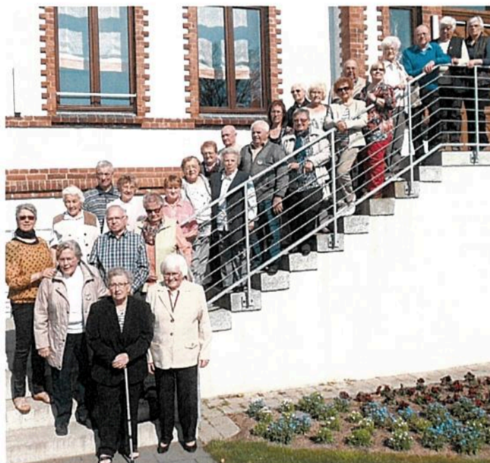
Reisende aus Frielendorf

Gemeinsam mit den Senioren der Gemeinde veranstaltete der Zweigverein Frielendorf eine Wochenfreizeit in Waren an der Müritz. Die Anreise war durch eine Panne beeinträchtigt. Am nächsten Tag wanderten wir nach einer Stadtrundfahrt mit der Tschu-Tschu-Bahn rund um den Tiefwareensee. Dienstag folgte eine Rundfahrt durch die Mecklenburger Schweiz zunächst nach Basedow mit seiner wertvollen Orgel,