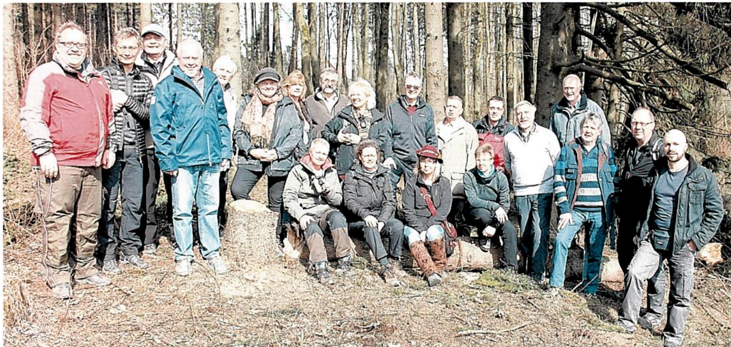
Wanderführer in der zehntägigen Ausbildung am Knüllköpfchen