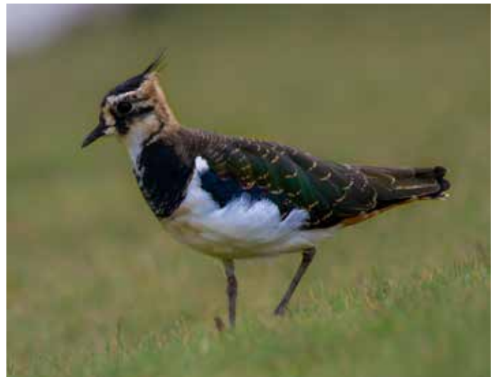
Der Kiebitz wurde zum „Vogel des Jahres 2024“ gewählt

Bedrohter Wiesenbrüter braucht mehr Feuchtgebiete. Sein Wahlslogan „Wasser marsch!“ bringt zum Ausdruck, woran es dem Kiebitz besonders fehlt: Entwässerung und intensive Landwirtschaft sorgen dafür, dass der Vogel des Jahres 2024 seinen natürlichen Lebensraum verliert.