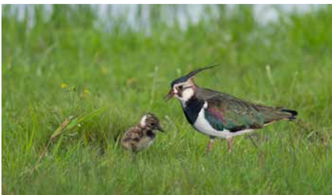
Nach 26 bis 29 Tagen schlüpfen die Küken

Kiebitze bevorzugen Flächen mit kurzer Vegetation, ohne Gehölze oder Sichtbarrieren. Ursprünglich waren sie vor allem in Mooren und Feuchtgrünland zu finden, doch diese gibt es mittlerweile seltener. Immer häufiger versuchen Paare auf ungeeigneten Äckern und Wiesen zu brüten, oft in lockeren Kolonien.