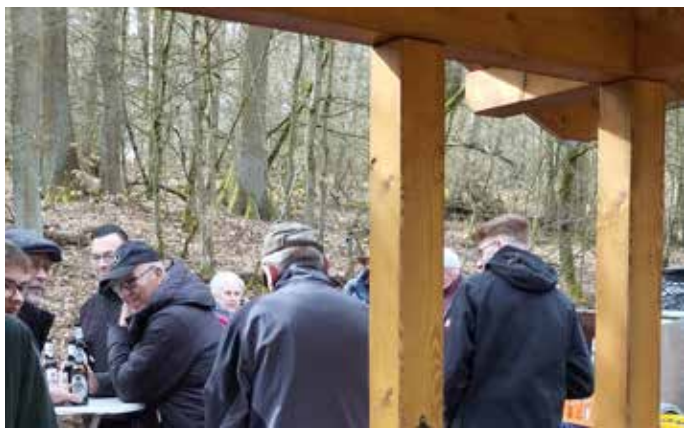
Neue Schutzhütte Eselsruh in Florshain.

Es ist bemerkenswert, wie durch tatkräftige Aktivitäten zur Selbsthilfe so ein Ort entsteht, der sich in die Landschaft wunderbar einfügt und ein Ort der Erholung schafft. Ein neues Kleinod ist in Florshain entstanden, wie schön! Der Knüllgebirgsverein freut sich mit den FlorshainerInnen.