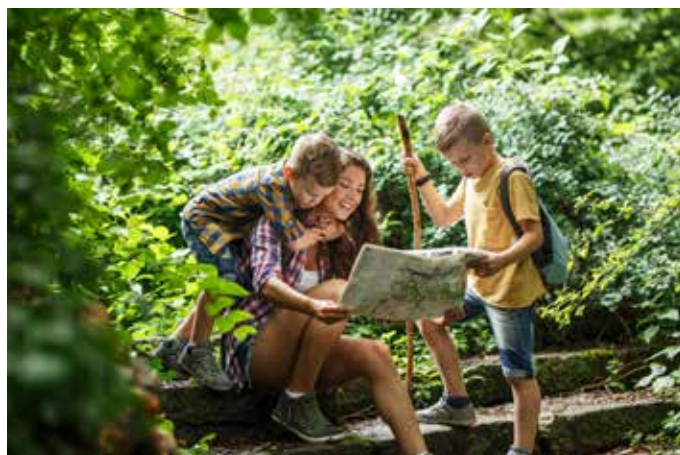
Wandern punktet - Coronabedingte Sonderregelung gilt ab 1. Januar nicht mehr.

Für Kitas und Schulen gibt es einen kleinen, bunten Wanderpass zum Abstempeln. Er ist bei dem Geschäftsführer erhältlich. Ich bitte die Zweigvereine, interessierten Wanderfreunden*innen den Vordruck „Meine Outdooraktivitäten“ zur Verfügung zu stellen.