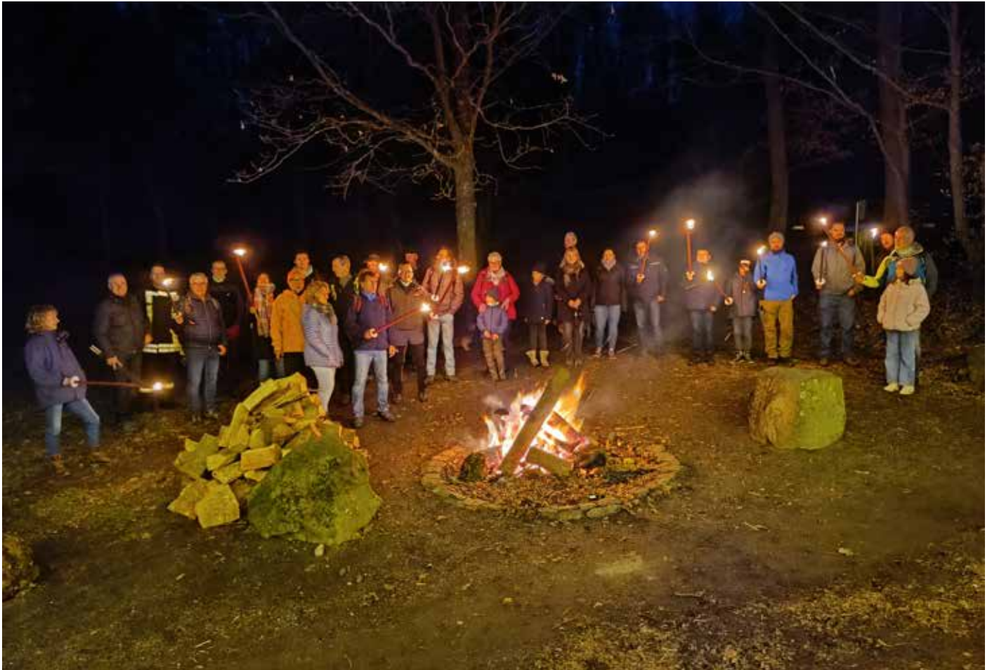
Unvergessliche Momente: Gruppenbild am Lagerfeuer während der Fackelwanderung im Eichwald Neukirchen