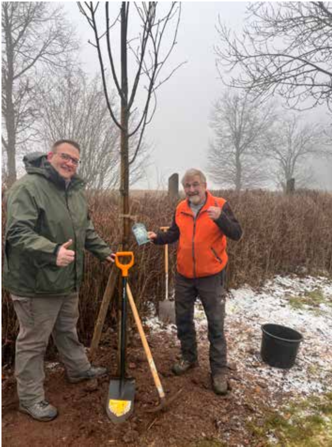
Im Rahmen der Baumpflanz-Challenge gepflanzt: Eine Mehlbeere in der Nähe des Infozentrums auf dem Knüll.