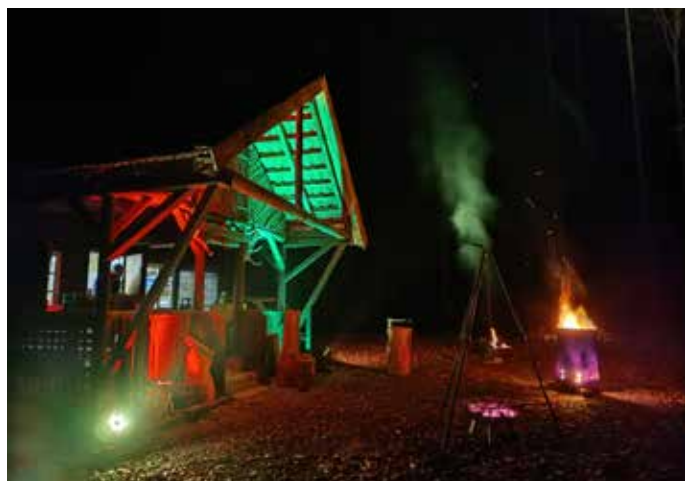
Stimmungsvolle Beleuchtung erwartete die Wanderer an der Waldhütte beim Klaushof.

Unser Vorsatz für das neue Jahr: Das wird zum Jahresende 2026 wiederholt.