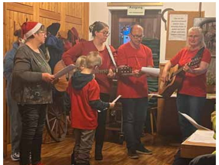
Die Gitarrengruppe sorgte mit ihren Melodien für eine stimmungsvolle Begleitung

...und wieder einmal durften wir unser Wanderjahr auf dem Knüll in einer Atmosphäre beschließen, die an das heimelige Wohnzimmer einer großen Familie erinnerte. Schon beim Eintreffen spürte man dieses besondere Gefühl von Zusammengehörigkeit, das unsere Gemeinschaft seit vielen Jahren prägt. Gespräche, Lachen, Wiedersehen – all das fügte sich zu einem warmen Klangteppich, der die Wintersonnenwendfeier zu einem echten Höhepunkt machte. Alle Generationen waren vertreten und jede einzelne hat ihren Teil zur wunderbaren Stimmung beigetragen. Dafür gibt es nur ein Wort: DANKE.