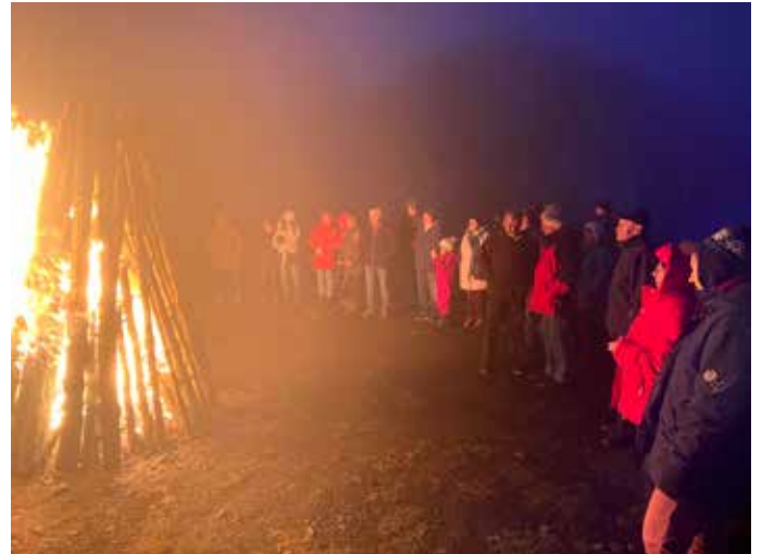
Schlusspunkt der Wintersonnenwendfeier - der brennende Feuerstoß

...und wieder einmal durften wir unser Wanderjahr auf dem Knüll in einer Atmosphäre beschließen, die an das heimelige Wohnzimmer einer großen Familie erinnerte. Schon beim Eintreffen spürte man dieses besondere Gefühl von Zusammengehörigkeit, das unsere Gemeinschaft seit vielen Jahren prägt. Gespräche, Lachen, Wiedersehen – all das fügte sich zu einem warmen Klangteppich, der die Wintersonnenwendfeier zu einem echten Höhepunkt machte. Alle Generationen waren vertreten und jede einzelne hat ihren Teil zur wunderbaren Stimmung beigetragen. Dafür gibt es nur ein Wort: DANKE.