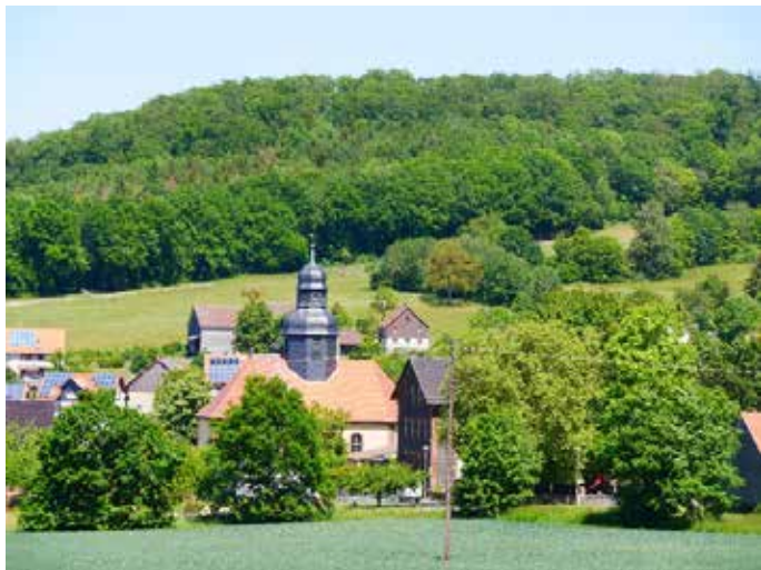
Rundwanderung auf dem Premiumwanderweg in Großropperhausen. Auf den Spuren derer von Baumbach

Anmeldung erforderlich beim Wanderführer Matthias Hucke E-Mail: matthiashucke@arcor.de oder 0163 6389321.